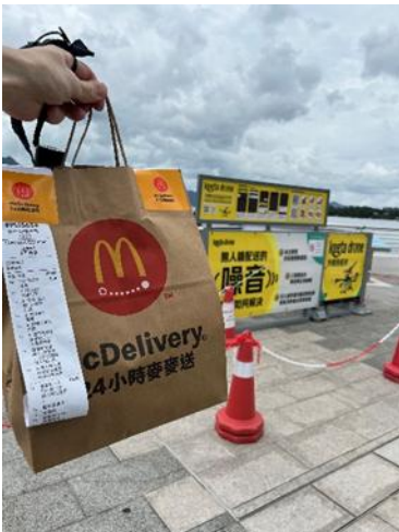
(写真：デリバリーされた商品)

開封してみると、飲み物は一滴もこぼれておらず、ハンバーガーもポテトも程よい温かさが保たれていました。「空を飛んできたハンバーガー」という特別感が、普段とは違った特別な味わいを感じました。