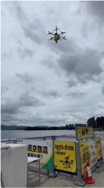
(写真：ドローン着陸用ブースの様子)

公園の指定エリアで待っていると、海の向こうから小さな点がだんだんと大きくなり、ドローンの形が見えてきました。ドローンは海上で一旦ホバリングした後、受け取りの指定エリアに正確に到着しました。