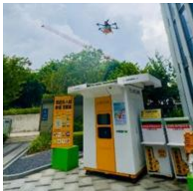
深センのドローン配送 自動受取ステーション

前稿では、中国深センの自動運転タクシーを紹介しましたが、ハイテク都市深センでは、ドローンのフードデリバリーも既に実用化されています。